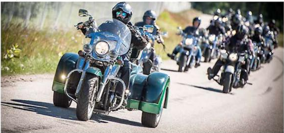
MOT SKARABORG. Vulcan Riders ordnade ett antal turer. Detta gäng är på väg till Barne-Åsaka.