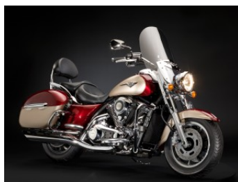
Candy Diamond Red / Pearl Luster Beige