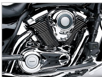
Mäktig 1700 kubiks V-twin