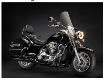
Metallic Diablo Black