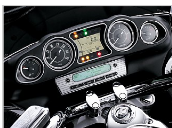
Instrumentering med många funktioner och