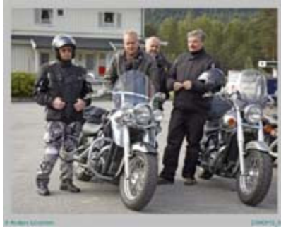
Frövi Raggarn Gnesta Tysken Pålle