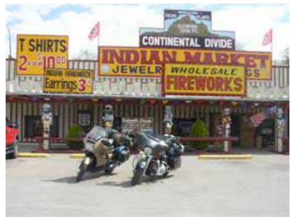
Continental Divide är den linje som sammanför de högsta topparna i Amerika och avdelar regnvetar lösnad respektive västland. Loppet börjar i Rocky och slutar i Mexico och omfattar såväl Rocky Mountain som Sierra Madre

Från Texas bär det nu i alla fall uppåt , uppåt i geografien och inte uppåt mot störst kanske men mot högre vyer och berglandskap. Bergslinjen Continental Divide binder samman Amerikas högsta toppar och delar av landet på höjden och landets nederbörd att rinna ut mot antingen Stilla havet eller Atlanten. Blåa berg och en färgrannare folklore. I städerna Tucumari, Santa Fe, och Albuquerque syns nu mexikanska sombreros, ponchos och serveras kryddstark mat.