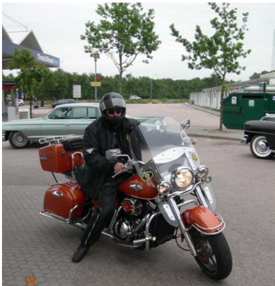
Mannen som stod för resans hjältemod vad gäller dansk hårdkörning!

Vi närmade oss alltså Danmark! Om bara en 20-30 mil skulle det bli myslunch på någon dansk Kro. Kanske en friterad spätta med remoulade, en iskall Tuborg och en rejäl bensträckare? Eller varför inte några feta, goda smörrebröd? Med knôfulla tankar brände vi iväg bort mot Öresundsbrons vägtullar. Life was good och fyllt av förhoppningar om vila och vederkvickelse!