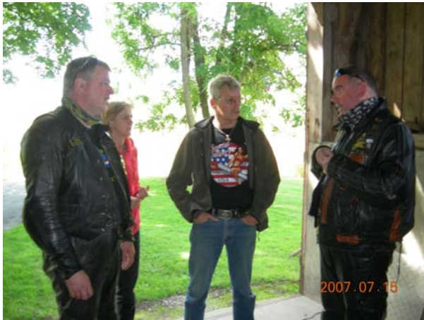
Dags att prutta hemåt! Tack för igår och en alldeles suverän dag!