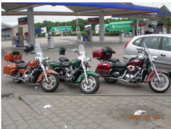
I Halmstad på Statoil, duggade det bara. Men lugn, strax skulle det hämta sig!