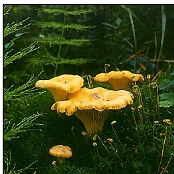
Herr Kantarell kan ta sig i dalen!

H ur många gånger har jag inte på senaste månaden träffat människor som älskar att plocka svamp. Med en patologisk frenesi beger de sig ut i "skog och mark" iklädda gröna gummistövlar och hund och pratar om "underbara färger" och "hög och klar luft". Sedan kommer de tillbaka med korgen fylld av olika sorters slemmiga tingestar vilka rengöres, fräses, förvälles och/eller torkas, förpackas, fryses in och sedan bjudes till allehanda rätter när man som intet ont anande kommer på besök. Ja, ja – jag skall inte klaga. Hittills har jag ju undkommit med livet och jag har heller inte behövt tillbringa