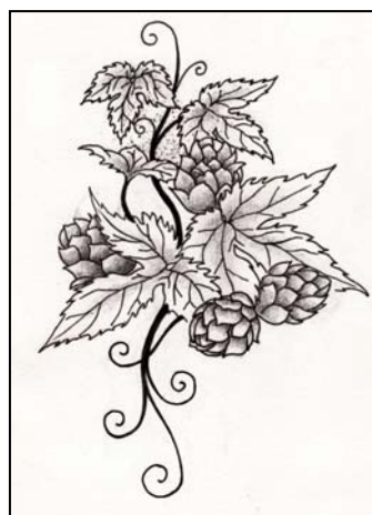
Monikas original i tusch och blyerts

I alla fall – med nyrätad rygg och totalformaterat liv, som änkeman med ny kvinna, barn som flugit ur boet och inte en siffra i ordning i livet som det brukat vara, kunde jag i alla fall avslappnat konstatera, att fann jag inget skäl att märka in det i skinnet, kunde framtida tatueringar kvitta. Vad är det som är viktigt i livet, egentligen?