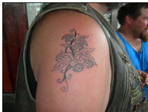
Paus efter första halvlek! Konturena är klara. En cigg eller två och sedan igång med skuggningen. Den var nästan värst! Aj!