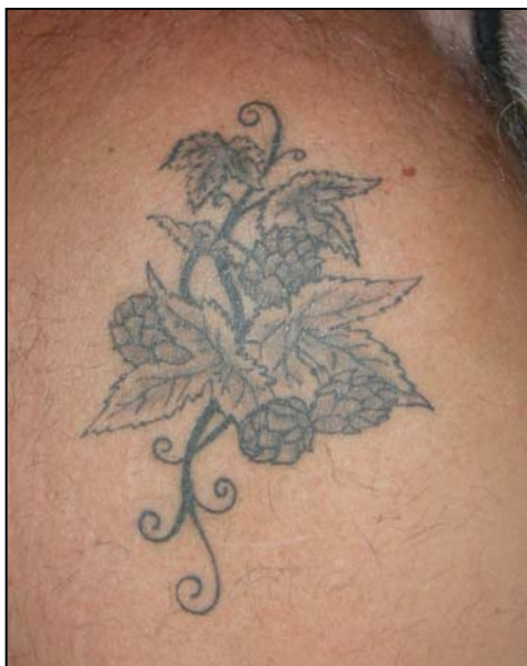
Då va're klart och läkt sedan några månader! För den här gången alltså...