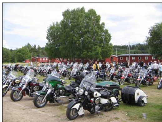
Pampig parkering är vi bra på – här ses presidentens Bertha bredvid teknikansvarigs och Malmös dåvarande RA:s och DA:s ekipage...

Riksträffen 2005 hade det pampiga temat "Vulcaner". Varje Riksträff har varit magisk på sitt sätt och det finns många berättelser och skrönor att lyssna på från dem som var med. I samband med att jag skrivit den här texten har jag fått lyssna på ett flertal, för själv var jag ju inte med i gänget förrän till hösten 2005. Jag skall inte berätta någon av dem här. Det är bättre att du får höra dem direkt av sådana som varit med när ni ses!