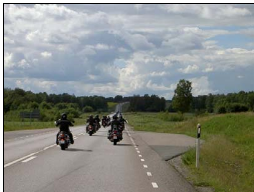
Vulcaner på riksträffsrally 2004