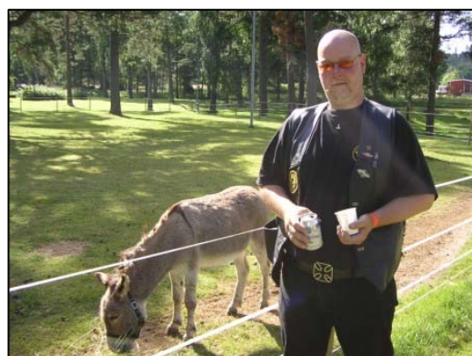
Den legendariska åsnan, som fram till för något år sedan fungerade som munter gryningsrevelj för sönderfestade vulcanister på Tänga...