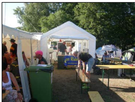
Gröt, ägg, slingor, smörgås med påläggbuffé, fil, mjölk, kaffe, te, juice, grönsaker och müsli... på en camping! Vem kan ordna det – jo VRS förstås...

Vulcan Riders Sweden är en mycket platt och decentraliserad organisation med våra 13 regioner och 45 distrikt. Under förra säsongen stod vi för mer än 150 arrangemang, de allra flesta ordnade