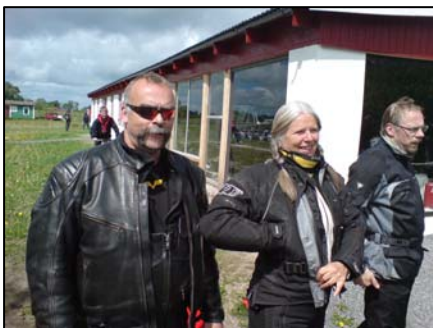
Lunchmätta Vulcaner i Degeberga

Eftermiddagen bjöd också på skön och välplanerad körning – en skvätt på grus genom Fyleåns dalgång, med nyutslagna bokskogar och kuperad natur, samt ett besök med eftermiddagsfika på Tryde 50-tals museum och nostalgicafé alldeles utanför Tomelilla. Har du inte varit på det muséet rekommenderas ett besök. Det finns förvisso muséer med bättre ordning på samlingarna och visst fanns det en hel del skräp – men också fantastiska retro-rum och vackert renoverade nostalgiprylar som man nästan fick en klump i halsen av att återse. Barndom, ljuva barndom!