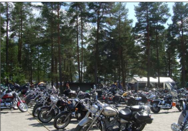
Hundratals hojar parkerade invid campingen Lygnevi i Sätilla... Bra fest i dagarna tre, arrangerat av Hising Island från Göteborg!