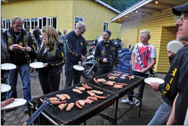
Laholmsrundan 2009 – varför kan jag aldrig komma iväg på den? De verkar ju ha det riktigt trevligt trots att jag inte är med...