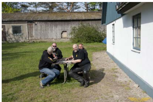
Visst är det jobbigt med vår, go'a vänner och Österlen! Tur att ingen skrev i Tanken om årets lyckade Fylerunda. Nu finns det mindre att förneka ☺

En grej kan man säga om vulcanister i allmänhet och om ovanstående i synnerhet: Behöver man hjälp, så får man det och det direkt och alltid med gott humör! Tack!