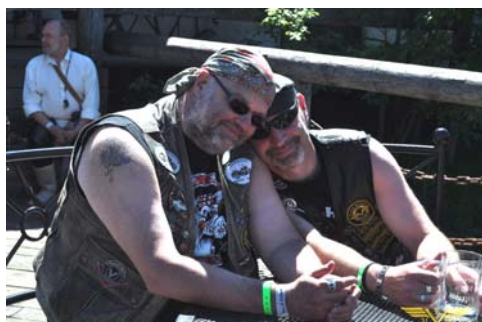
Detta har inte hänt. Det är ett illasinnat fotomontage av #6070 där det antyds att det skulle ha druckits Tequila och pilsnerdricka i Mexicobyn på High Chaparral. Fjärran är ännu sensommarens lunginflammation...