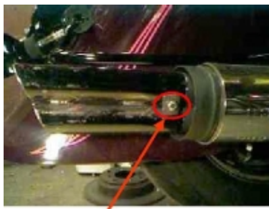
Bricka 20x20mm med M6 L=50.